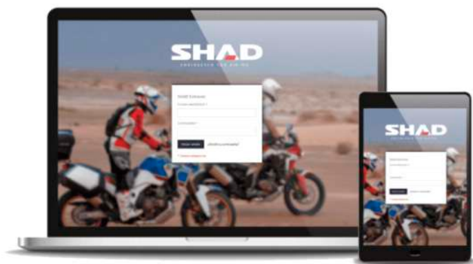
Ejemplo de comercio electrónico B2B.

Se puede realizar la consulta de productos, datos de la cuenta, consulta de clientes y estadísticas.